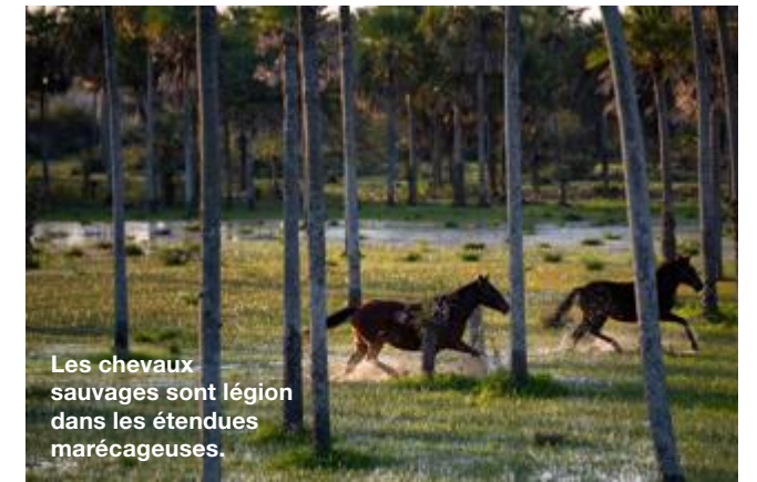
Les chevaux sauvages sont légion dans les étendues marécageuses.