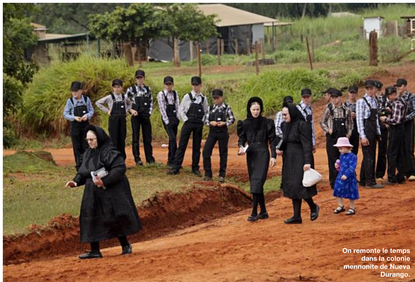
On remonte le temps dans la colonie mennonite de Nueva Durango.

Cap au nord-est, vers le Parc national Cerro Corà. « Parc national » est un bien grand mot. Aucune signalétique sur place, sauf un centre d'accueil chétif où somnolent deux gardes forestiers. Mais quel émerveillement ! Sur une trentaine de kilomètres, la plaine herbeuse est constellée de cerros, sortes de mamelons rocheux à la fois massifs et gracieux qui culminent à 200 mètres d'altitude. Au crépuscule, ces pitons irradient de couleurs rougeoyantes. On dirait une Monument Valley en miniature, brute et esseulée.