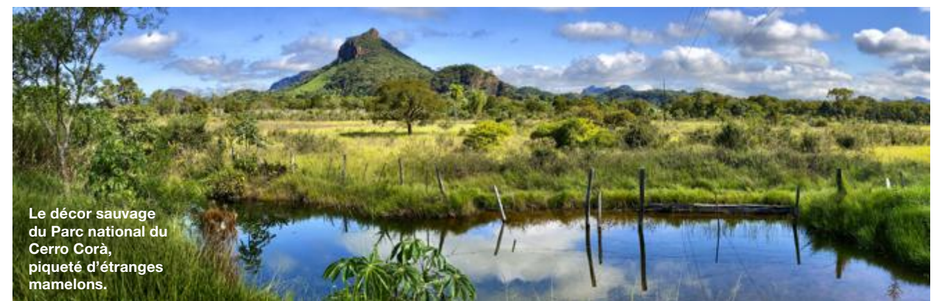
Le décor sauvage du Parc national du Cerro Corà, piqué d'étranges mamelons.