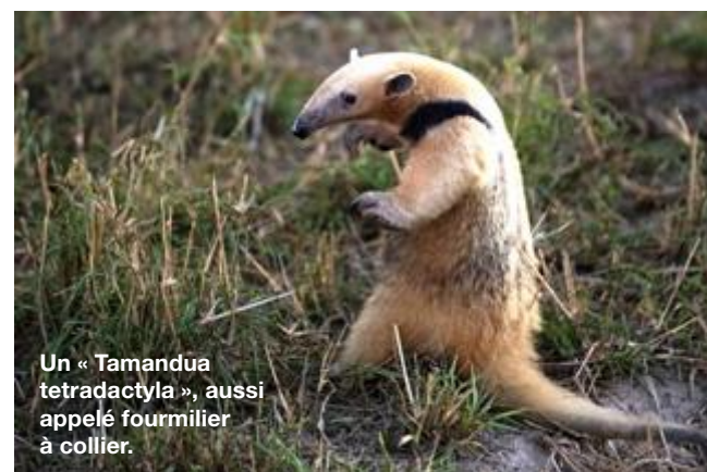
Un « Tamandua tetradactyla », aussi appelé fourmilier à collier.