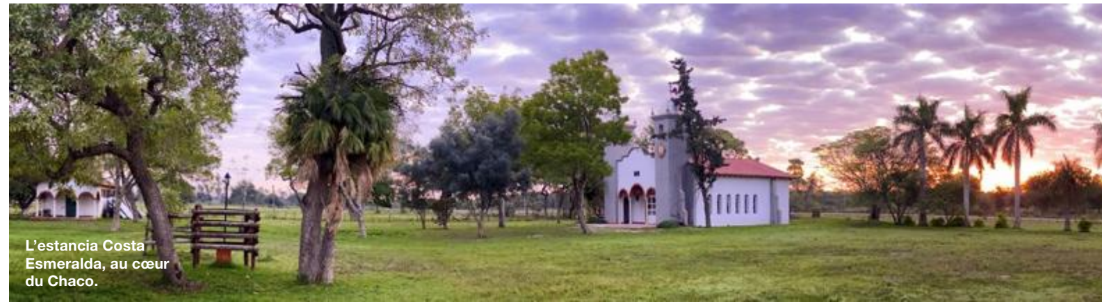
L'estancia Costa Esmeralda, au cœur du Chaco.