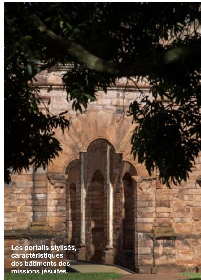
Les portails stylisés, caractéristiques des bâtiments des missions jésuites.