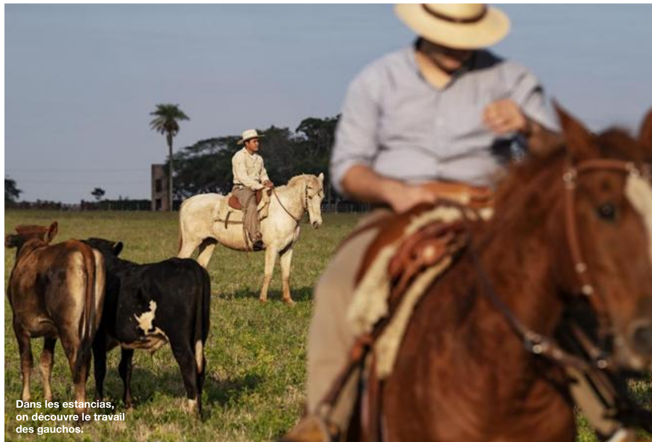
Dans les estancias, on découvre le travail des gauchos.