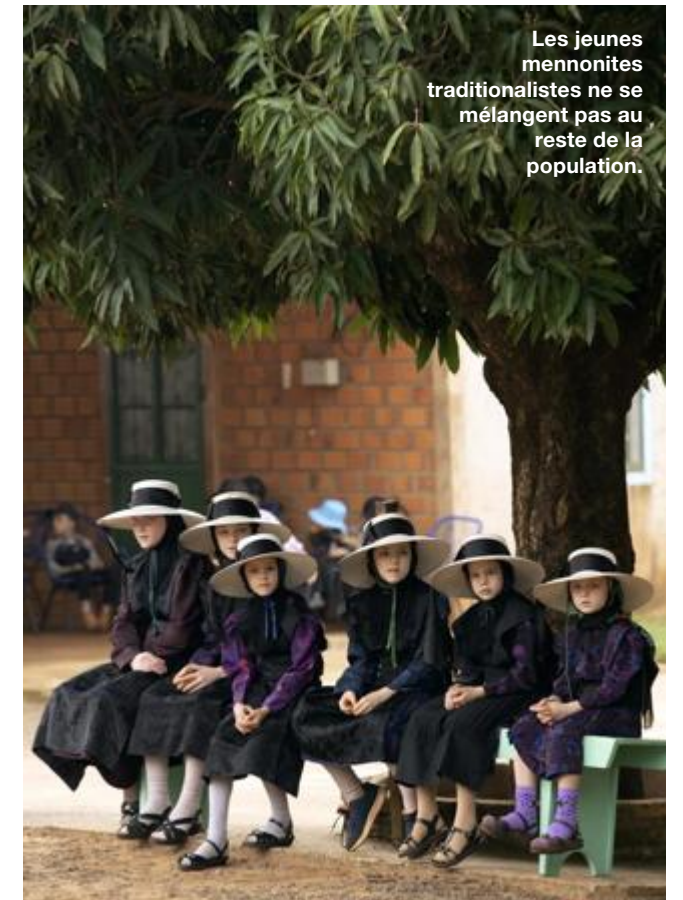
Les jeunes mennonites traditionalistes ne se mélangent pas au reste de la population.